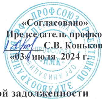
График ликвидации академической задолженности по экзаменационным и зачётным дисциплинам II семестра 2023-2024 уч. года (первая пересдача) для студентов специальности 31.02.05 Стоматология ортопедическая