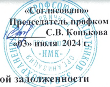
График ликвидации академической задолженности по экзаменационным и зачётным дисциплинам II семестра 2023-2024 уч. года (первая пересдача) для студентов специальности 31.02.01 Лечебное дело