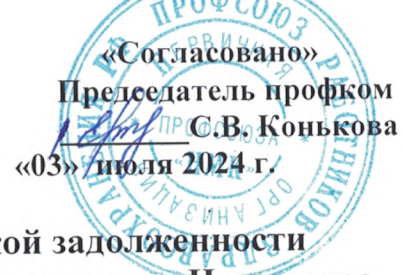
График ликвидации академической задолженности по экзаменационным и зачётным дисциплинам II семестра 2023-2024 уч. года (первая передача) для студентов специальности 34.02.01 Сестринское дело 31.02. акушерское дело